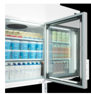
LED-lys i dørramme