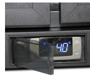
Beskyttende afskærmning af termostat