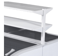
Præsentationshylder er tilbehør