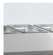
Tager GN1/3 kantiner (ikke inkluderet)