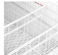
Justerbar falsk bund