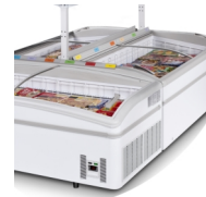
Ø-installation (hylde er tilkøb)