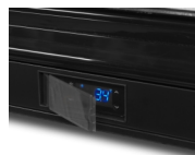
Beskyttende afskærmning af termostat