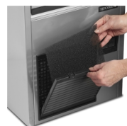
Kondensatorfilter er nemt at rengøre