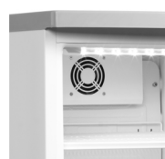
Køling med ventilator