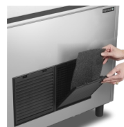
Kondensatorfilter er nemt at rengøre