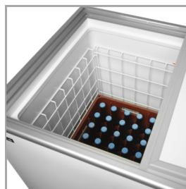
Velegnet til øl- og sodavandskasser