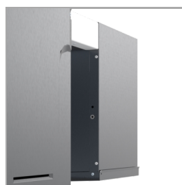
Bagside af monoblock - ingen panel fastmonteret