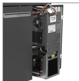
Køleenheden kan tages ud for nem service