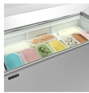
Kurve til 5 liters plastikbeholdere som tilkøb