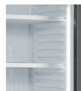
Vertikalt, indvendig lys